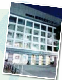
開演は19時。夜の練馬文化センター

▶会場では、入場時の検温や消毒薬でしっかりと感染対策がとられていました。演奏者はマスク姿、握手ではなくグータッチ。