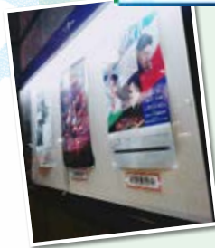
会場前にはポスターが

▶会場内では「感染対策のため『ブラボー』などの声かけはご遠慮ください」とアナウンスが。また「会場内での会話はお控えください」との表示も。終演後は、混雑を防ぐため順番に席を立つよう指示がありました。